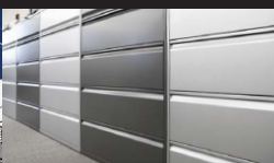
Assemblage et fabrication de métal en feuille