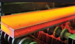
Traitement thermique et traitement de surface