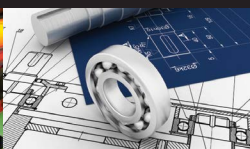
Ingénierie et services techniques industriels