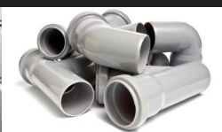
Plastiques et composites