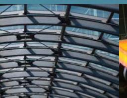
Structures et plaques métalliques