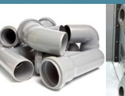
Plastiques et composites