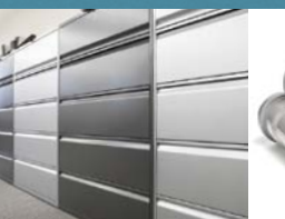
Assemblage et fabrication de métal en feuille