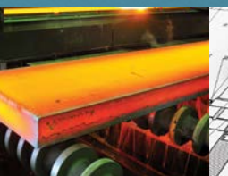
Traitement thermique et traitement de surface