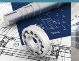
Ingénierie et services techniques industriels